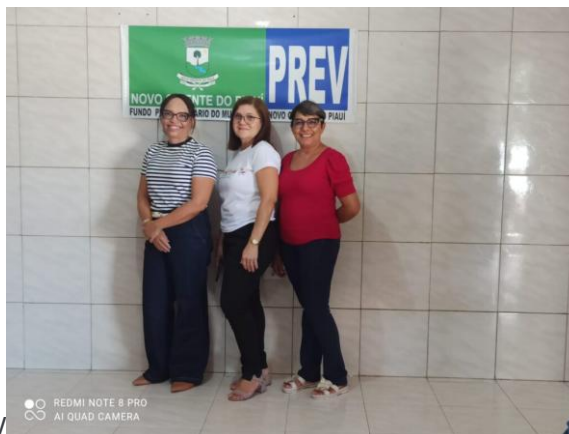
Comitê de Investimentos-NOPREV