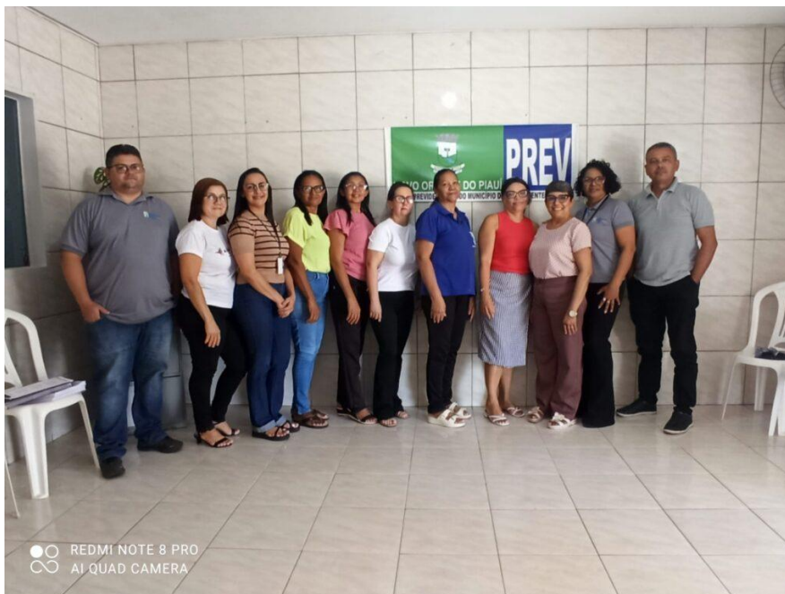
INFORME MENSAL DOS RPPS – Edição LXIII – NOV 2025

Departamento dos Regimes de Previdência no Serviço Público – DRPPS da Secretaria de Regime Próprio e Complementar do Ministério da Previdência Social que tem como atribuições, a orientação, fiscalização, supervisão e acompanhamento dos RPPS; normatização dos parâmetros gerais para esses regimes, bem como estruturação e recebimento de dados, entre outras atividades, divulga mensalmente o “ Informativo Mensal dos RPPS ”, criado com a finalidade de atualizar os gestores, conselheiros, servidores e demais profissionais que atuam nesse segmento, dos principais temas voltados aos Regimes Próprios de Previdência Social – RPPS e das principais medidas adotadas por este Departamento visando o fortalecimento desses regimes.