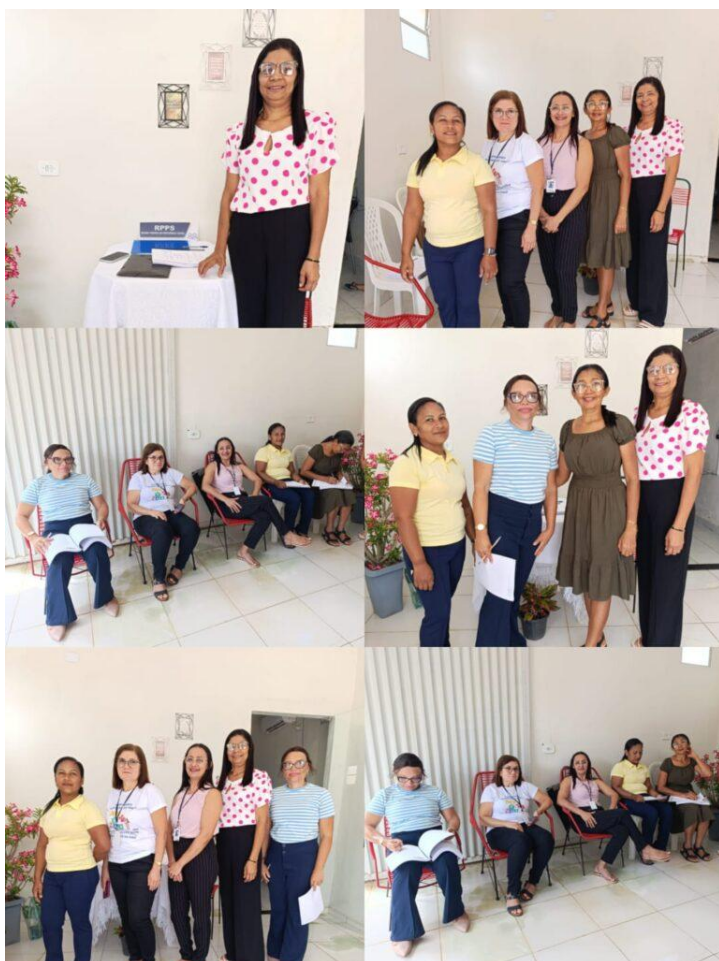
INFORME MENSAL DOS RPPS – Edição LVI – ABR 2025

Na manhã dessa quinta-feira, dia 24 de abril, o Fundo de Previdência Municipal dos Servidores de Novo Oriente do Piauí (NOVO ORIENTE DO PIAUÍ-PREV) explorou a Prestação de Contas referente à competência de março de 2025 junto aos membros do conselho deliberativo e fiscal, no qual concluíram que as referidas Demonstrações Financeiras obedecem aos dispositivos legais e regulamentares aplicáveis, e estão em condições de serem apreciadas pelo Tribunal de Contas do Estado do Piauí.